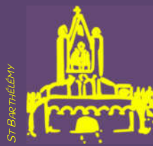
Plaisance du Touch