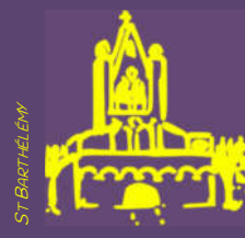
Plaisance du Touch