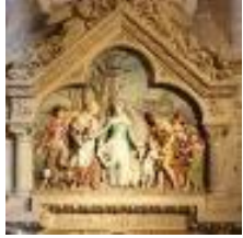
Bas relief chapelle St Germain

L'église « une symphonie inachevée » d'une surface de 100 x 32 mètres de large, repose sur un soubassement formé de deux cryptes.