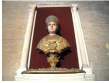
Buste de St Aubin