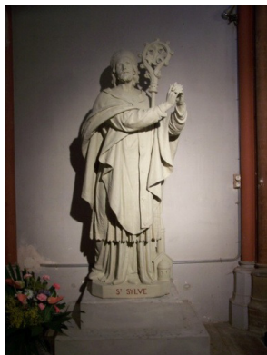
Statue de Saint Sylve

C'est lui qui a fait construire Saint Sernin (représentation de la 1ère église à ses pieds).