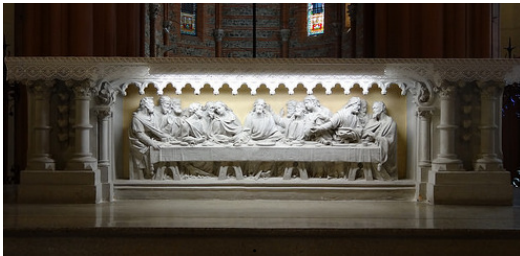
Maître autel (1890) le bas-relief, sculpté par Giscard, représente la Cène d'après Léonard de Vinci. Le modèle original est à l'église Saint-Aubin.

Les murs s'élèvent à la façon économique toulousaine : deux rangées de briques cuites, deux ou trois rangées de galets de la Garonne, le tout lié par un mortier maigre.