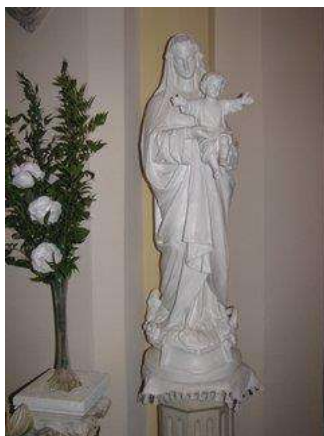
Vierge blanche à l'enfant

À droite de la nef également le monument aux morts en marbre blanc.