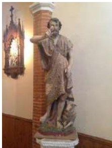
Saint Jean-Baptiste Patron de l'église

Le chœur actuel constituait l'ancienne nef. La chapelle St Joseph était l'entrée de la seconde église. La chapelle du Rosaire est le vestige de la première église (St Prim).