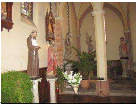
Statuaire dans le fond de l'église