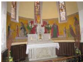
Chapelle dédiée au Rosaire

Il y a 3 chapelles autour du chœur : à gauche la chapelle St Joseph, à droite la chapelle du Sacré-Cœur et au fond la chapelle du Rosaire (les vitraux représentent les apparitions de Lourdes et de notre Dame de la Salette).