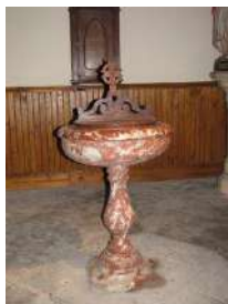
Le Baptistère en marbre rose

Tout autour de la nef vous pourrez suivre un magnifique chemin de croix en métal argenté encadré de bois verni.