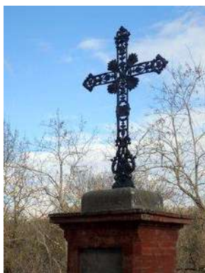
Croix de l'ancienne église Saint Prim