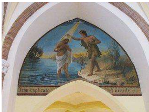
Baptême du Christ

À droite et au fond de la nef vous pourrez admirer un tableau de la mise au tombeau.