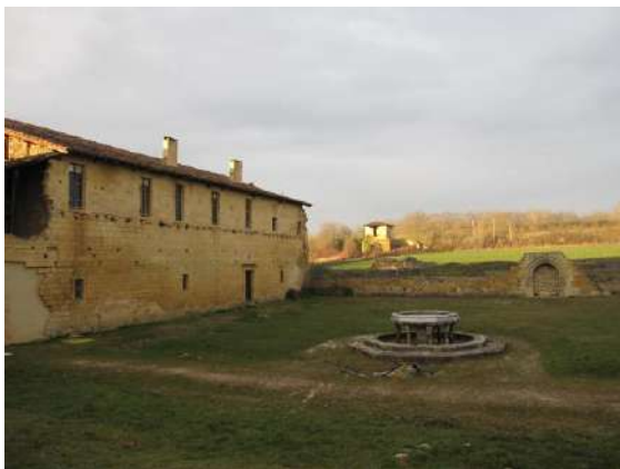
Vue actuelle du site (2012)

Commune de Proupiary (Haute-Garonne, canton de Saint-Martory)