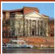
Basilique Notre-Dame la Daurade 1 place de la Daurade

En 1077, l'évêque de Toulouse, Isarn, confie l'antique monastère « Sainte-Marie » de cette ville et la basilique de la Daurade aux belles mosaïques à fond d'or, à l'ordre prestigieux de Cluny. Le monastère devient alors un prieuré dépendant de l'abbaye bénédictine de Moissac. C'est dans ces lieux que se développent trois ateliers successifs de sculpture qui réalisent les beaux chapiteaux romans du cloître conservés aujourd'hui au musée des Augustins. L'ordre réformé au XVII e siècle est supprimé à la Révolution.