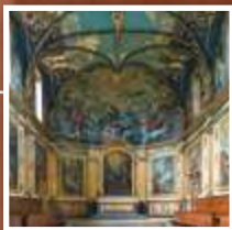
Chapelle des Carmélites 1 rue du Périgord

Il ne reste rien du grand couvent qu'occupaient les Carmes sur la place éponyme. Celui des Carmélites a été démoli à la Révolution à l'endroit où s'élève la Bibliothèque municipale mais subsiste la chapelle, qu'on appelle « La petite chapelle Sixtine toulousaine », bijou légèrement rococo, d'un baroque modeste qui accueille toujours comme du temps des moniales le grand public.