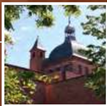
Saint-Pierre des Chartreux 21 rue Valade

Chassés en 1602 de Saïx près de Castres, les Chartreux s'installent dans Toulouse intra muros , fait exceptionnel pour une congrégation habituée à vivre dans des lieux plutôt sauvages comme la Grande Chartreuse. Fidèles à leur fondateur saint Bruno, ils vivront leur engagement religieux dans le silence et la prière jusqu'à la Révolution.