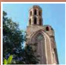
Rue du Collège de Foix

En 1222, les Franciscains, appelés aussi Cordeliers, édifient un grand couvent où se déroulaient de nombreuses cérémonies fastueuses. Célèbre pour son caveau funéraire qui préservait les corps de la corruption, le couvent fut mis au pillage en 1562 par les protestants et l'église complètement détruite par l'incendie de 1871. Subsistent aujourd'hui le clocher et le portail.