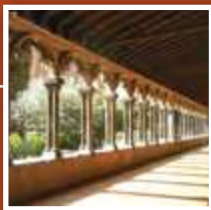
Musée des Augustins 27 rue de Metz

Les Augustins, plus de 200 moines au XIV e siècle, occupent un ensemble monastique grandiose au cœur de la cité ; il sera victime en 1463 d'un grave incendie, en 1542 d'un pillage méthodique, de la foudre en 1550. En 1794, le couvent devient le premier musée de France. Il possède un trésor artistique religieux considérable.