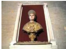
Buste de St Aubin