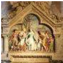
Bas relief chapelle St Germain

L'église « une symphonie inachevée » d'une surface de 100 x 32 mètres de large, repose sur un soubassement formé de deux cryptes.