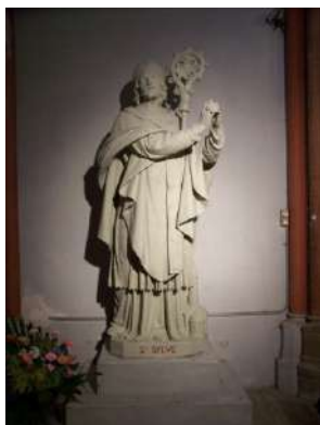
Statue de Saint Sylve

C'est lui qui a fait construire Saint Sernin (représentation de la 1ère église à ses pieds).