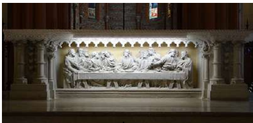
Maître autel (1890)

Les murs s'élèvent à la façon économique toulousaine : deux rangées de briques cuites, deux ou trois rangées de galets de la Garonne, le tout lié par un mortier maigre.