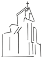
St Julien (Le Fauga)