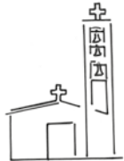
St Leger (Eaunes)