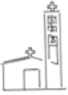
St Leger (Eaunes)