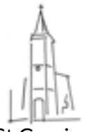
St Cassien (Estantens)