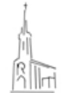
St Martin (Ox)