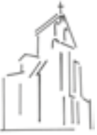
St Julien (Le Fauga)