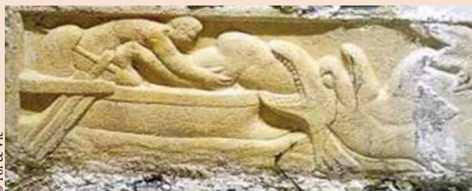
Jonas entrant dans la gueule du monstre marin, à la basilique Saint-Just-Valcabrère.

L'image du poisson est très répandue dans l'art paléochrétien, notamment dans les catacombes sous forme de graffiti, puis dans les baptistères richement décorés. Accrochés à un double hameçon cruciforme ou nageant dans la piscine baptismale, ils représentent l'âme humaine, les nouveaux fidèles convertis au Christ, « Je vous ferai pêcheurs d'hommes » (Mt 4,19) et sauvés par l'eau du baptême. Les célèbres mosaïques de Tabgha représentent deux poissons et un panier de pain. Cela illustre un événement