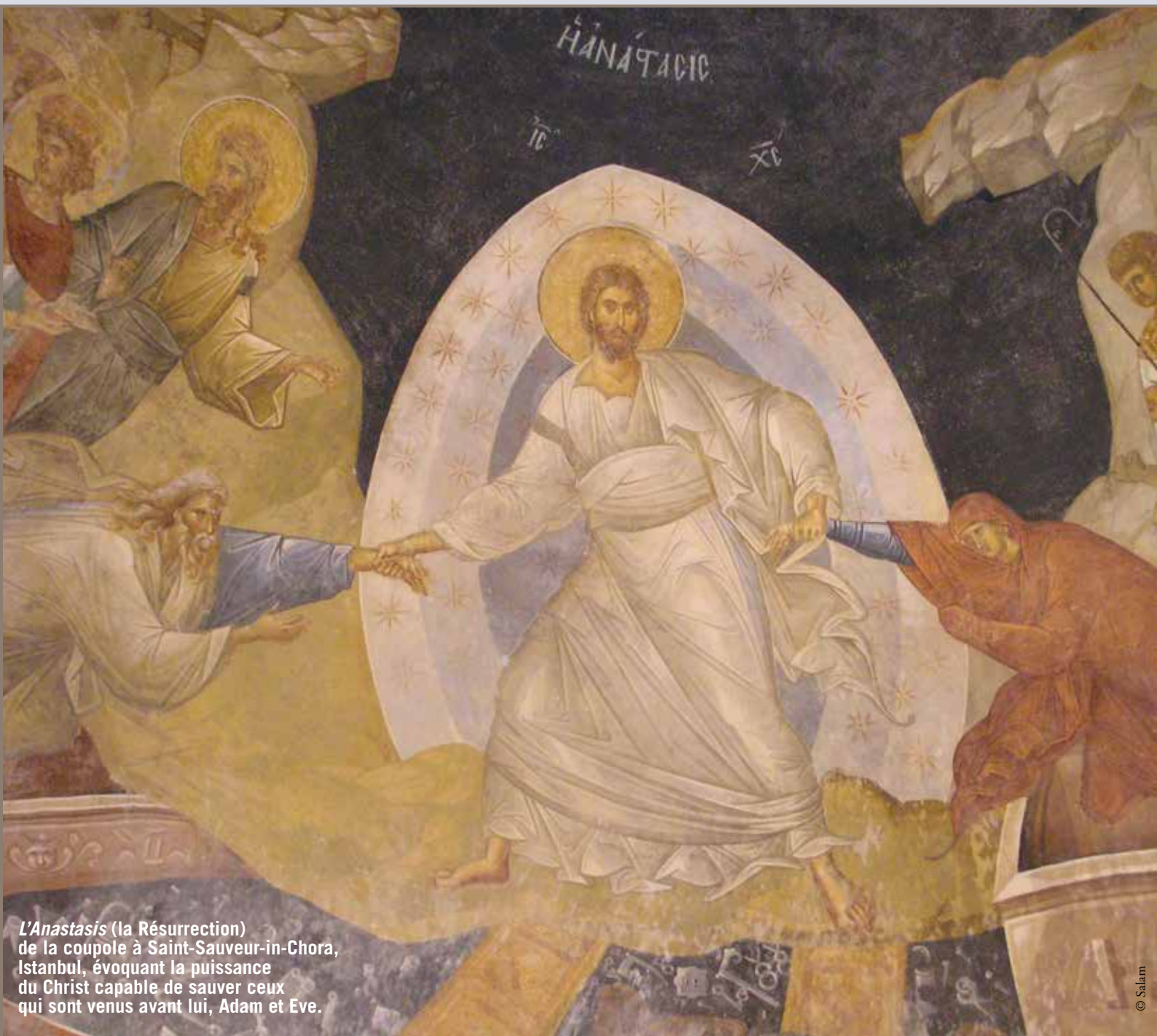
L'Anastasis (la Résurrection) de la coupole à Saint-Sauveur-in-Chora, Istanbul, évoquant la puissance du Christ capable de sauver ceux qui sont venus avant lui, Adam et Ève.