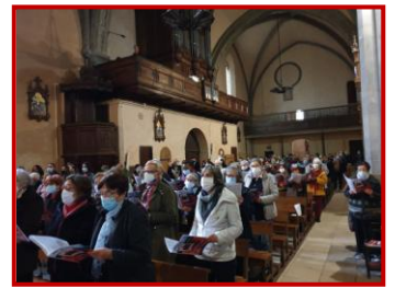
Fête du chant liturgique

Chers amis choristes du chœur diocésain, du diocèse de Toulouse ou d'ailleurs..... Chantons en « Cor » vous accompagnera « encore » pendant ce mois de novembre pour :