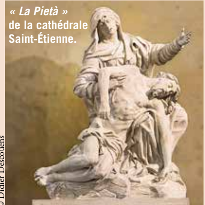
« La Pietà » de la cathédrale Saint-Étienne.

L'œuvre d'art majeure de la cathédrale toulousaine reste incontestablement le maître-autel baroque réalisé par Gervais Drouet. Si vous y entrez cependant, par le portail ouest, vous ne manquerez pas d'y admirer une « Pietà » à droite, une autre des œuvres du sculpteur toulousain réalisée en 1648. Le corps sans vie du Christ repose sur les genoux de la Vierge qui le maintient avec respect de sa main droite voilée. L'expression de son visage et le geste qu'elle esquisse de la main gauche témoignent de la douleur d'une mère face à la mort de son enfant. Qui mieux que Marie peut comprendre la souffrance humaine ? L'expression du visage de la mère de Dieu, la relation qui se crée entre elle et son fils comme les drapés des tissus sont caractéristiques d'un art baroque appris aux côtés mêmes du célèbre Bernin à Rome. Le thème de la Déploration de la Vierge ou Vierge de Pitié remonte au XII e siècle et a été inspiré par la piété populaire. Ne figurant pas dans les Évangiles, cette scène se situe traditionnellement entre la descente de Croix et la mise au Tombeau.