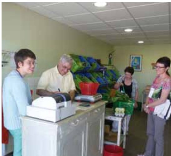
Vente des produits du maraîchage à la boutique, sur le site de l'Arche.

parfois un peu de maraîchage encadré par elles ! Leurs témoignages sont souvent très positifs. Et les personnes qui travaillent au maraîchage très valorisées.