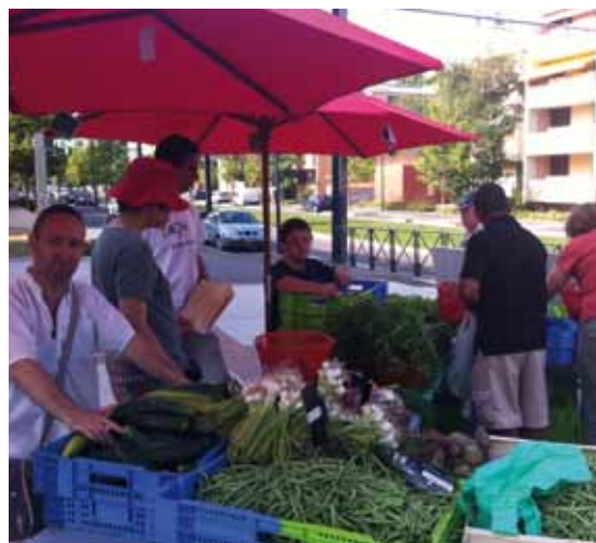
Vente des mêmes produits sur le marché de Blagnac, près d'Odysud

• Contact : Communauté de l'Arche en pays toulousain 2, rue du docteur Guimbaud - 31700 Blagnac Tél. : 05 62 87 11 20 - www.archepaystoulousain.org