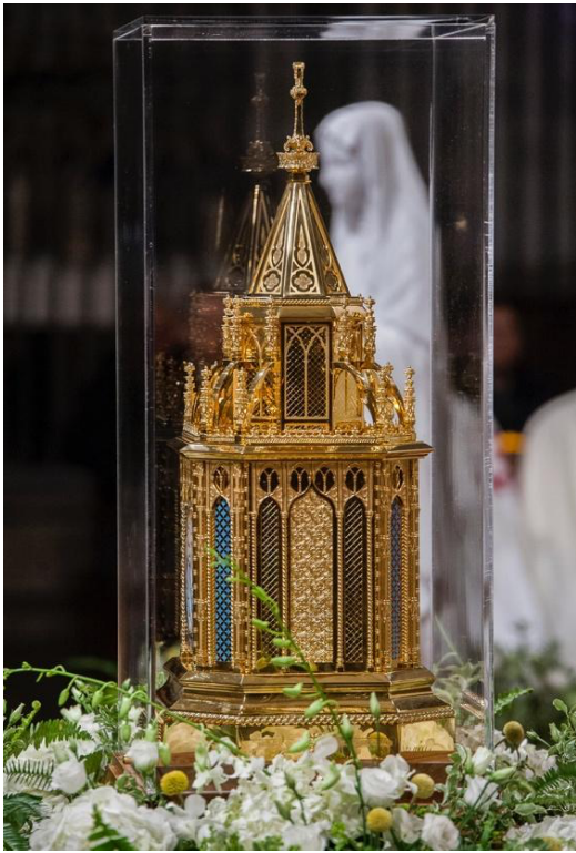
Reliquaire de sainte Bernadette Soubirous