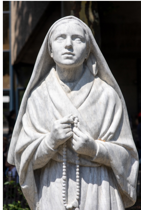
Statue de sainte Bernadette

Avec la bienveillance du Sanctuaire de Lourdes et à l'initiative du Pèlerinage National de l'Assomption, de l'association et l'Hospitalité Notre-Dame de Salut, avec l'accompagnement de la Famille de l'Assomption, le pèlerinage du reliquaire de sainte Bernadette s'accomplira en lien étroit avec les lieux d'accueil, les hospitalités diocésaines et du Rosaire.